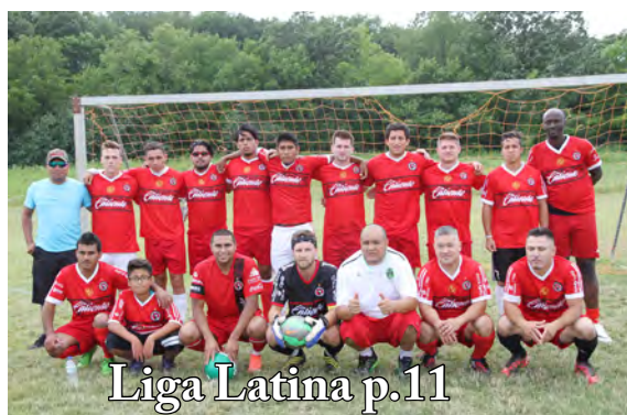
Liga Latina p.11