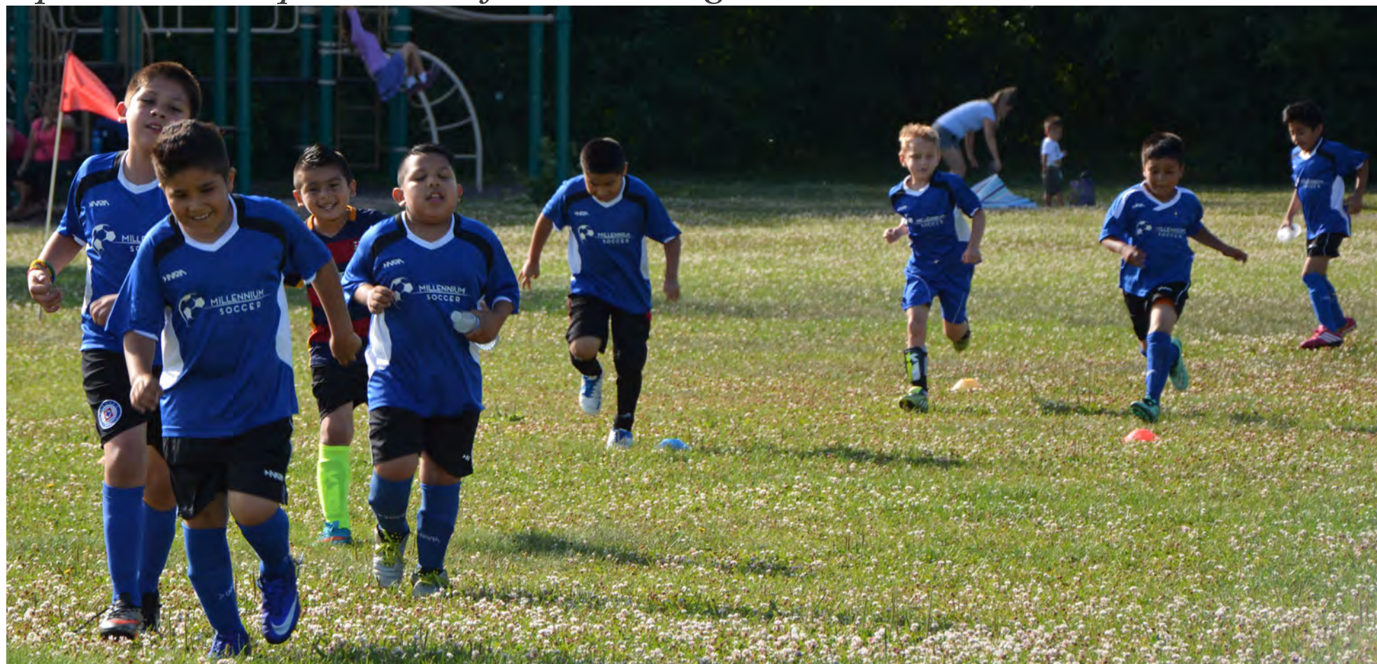
Los niños de Millennium Soccer Club hacen calentamiento antes de jugar. (Continúa en la página 6)

En Madison, Habush Habush & Rottier y un equipo de fútbol local auspician a Millennium Soccer Club, un club deportivo que da la oportunidad de pertenecer a una institución deportiva a niños que vienen de familias con ingresos modestos.