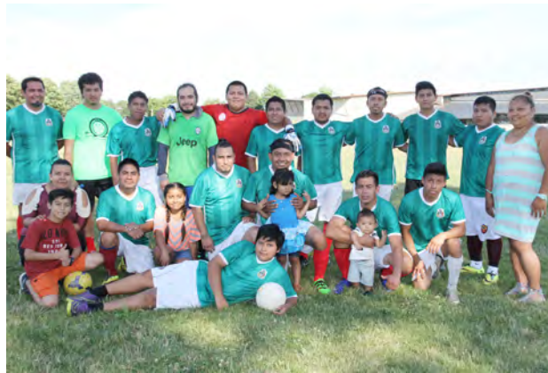
Agrupación "México", equipo conformado por jugadores en su mayoría de la ciudad de Puebla, México.