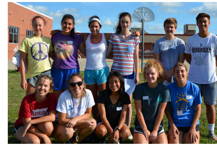
Los entrenadores de Millennium Soccer Club

"Siempre he tenido oportunidades de practicar y aprender de otras personas, pero muchos de estos niños no tienen esa oportu-