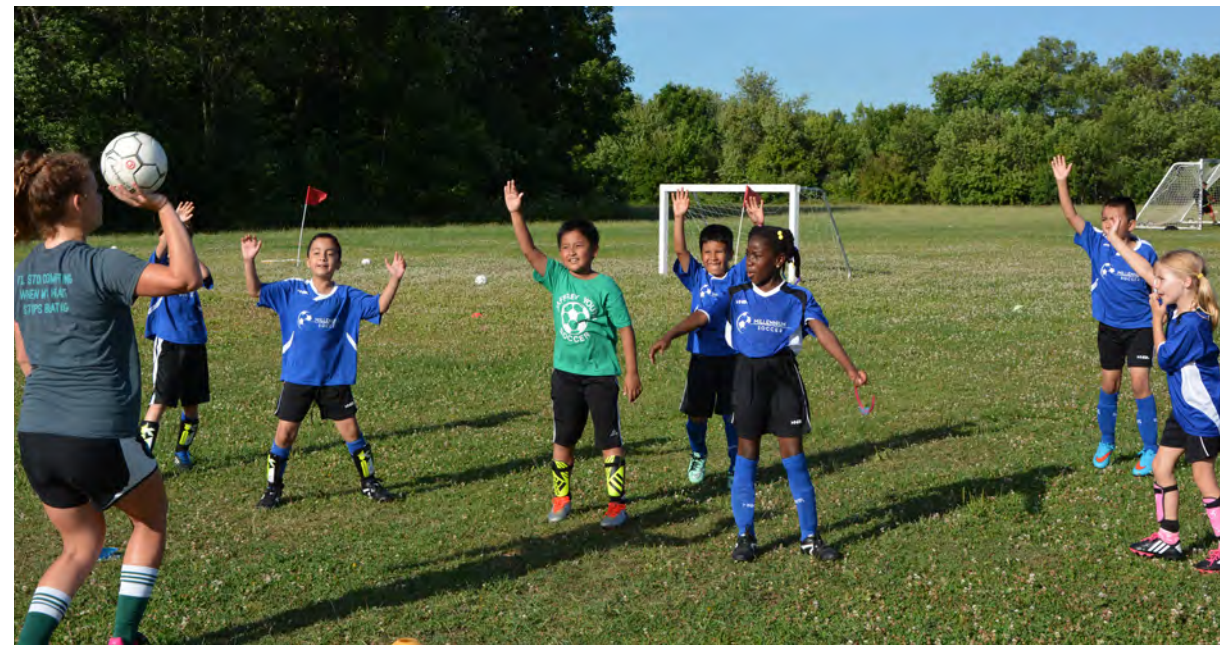
Los niños de Millennium Soccer Club juegan en las canchas de Leopold Elementary School

En Madison, Habush Habush & Rottier y un equipo de fútbol local auspician a Millennium Soccer Club, un club deportivo que da la oportunidad de pertenecer a una institución deportiva a niños que vienen de familias con ingresos modestos.